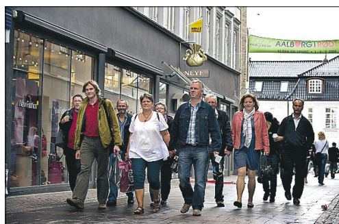
GODT TRE kilometer blev der gået mellem dagens smagsprøver.

ægteparret kunne sammen med resten af holdet, nemt blive enige om, at de også næste år vil deltage i Ølentusiasternes markering af Ølets dag.