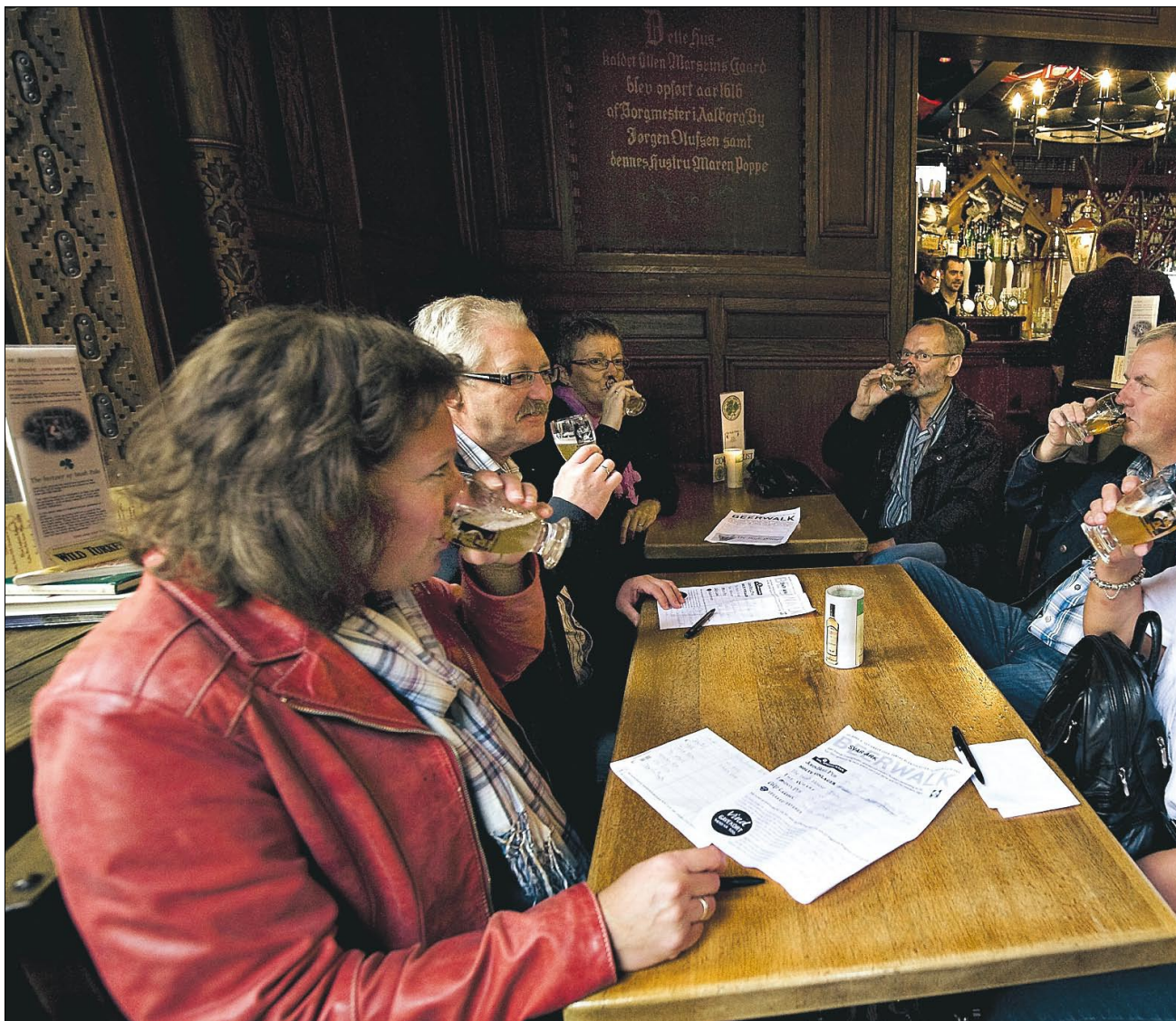
RUND OM bordene blev smagsprøverne diskuteret inden det endelige bud blev afgivet.

Selvom hver af de otte øl kom med tre svarmuligheder, var det nemt at fornem-