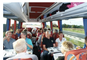
Bussen er på E45