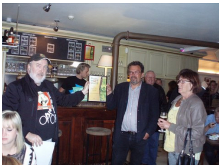
Brewpub - Charlies bar - Lord Nelson