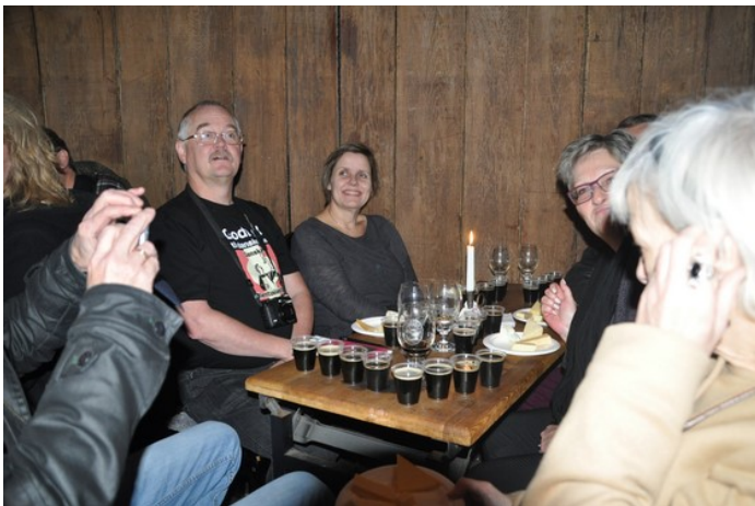
Lørdag den 14. november