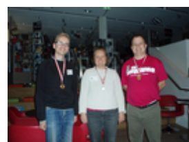
Sølv til København