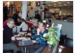
Holdet fra Esbjerg