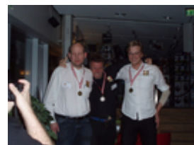
Bronze til Næstved