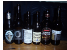
De 6 øl i 2. halvleg