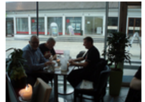
Holdet fra Rødovre