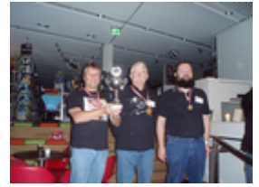
Guld og pokal til Roskilde