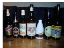
De 7 øl i 1. halvleg

Der var nu ikke mere på programmet, så Lokalafdeling København, der havde stået for arrangementet sagde pænt tak for i aften og god rejse hjem. Inden vi skildtes lovede Lokalafdeling Roskilde, at de ville lave et tilsvarende arrangement i 2012. Det glæder vi os til, og håber at flere vil deltage næste gang. Det er ret sjovt!