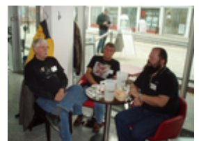
Holdet fra Roskilde