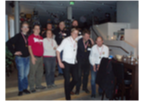
De 3 bedste hold