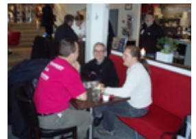
Holdet fra København