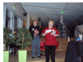
Klar til præmieuddeling