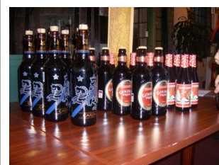
Vi vil have mere GODT øl