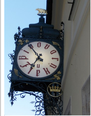
Øllet er ok