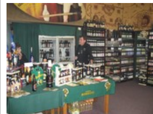
Et fantastisk sted